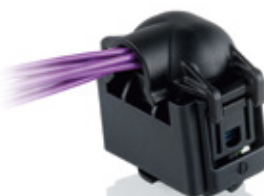
D型: 适用于安装空间非常紧凑的纵向出线口(扁平型保护帽)