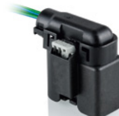
E型: 适用于安装空间非常紧凑的前端出线口(扁平型保护帽)